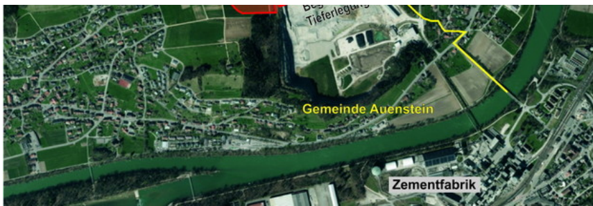
Die Erweiterung aus der Vogelperspektive: Der Steinbruch soll an drei Enden erweitert und tiefer gelegt werden.

Die Einschränkungen: Der Richtplan-Entscheid ist nur ein Grundsatz-Entscheid. Die betroffenen Gemeinden Auenstein und Veltheim werden ihre Nutzungspläne anpassen müssen, die Jura Cement braucht auch noch eine Baubewilligung. Im Rahmen dieser «nachgeordneten Verfahren» werden dann zusätzliche Bedingungen formuliert.