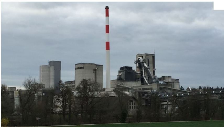
Die Zementfabrik Wildeggen produziert 18 Prozent des Schweizer Zements. Das sei nachhaltiger als Import, sagen die Grünen.

Ohne zusätzlichen Kalkstein seien die Firma und ihre 120 Arbeitsplätze gefährdet, sagt die Aargauer Regierung. Sie hat sich auch deshalb für die Richtplan-Anpassung stark gemacht.