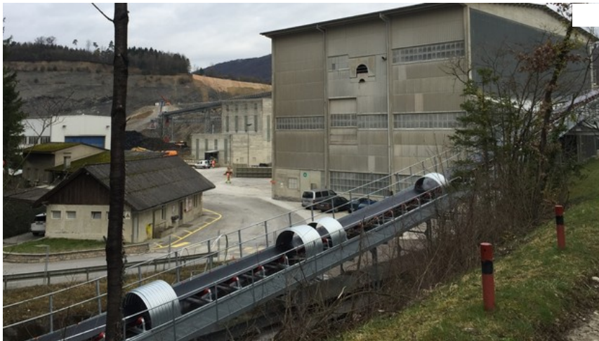
Die Vorräte im Steinbruch Jakobsberg reichen noch fünf bis sieben Jahre für die Zementfabrik in Wildegg.

Die Zementfabrik Wildegg darf den Steinbruch Jakobsberg-Egg erweitern. Der Grosse Rat hat die Erweiterung des Steinbruchs in Auenstein und Veltheim in den kantonalen Richtplan aufgenommen. Viele Parlamentarierinnen und Parlamentarier erwarten aber klare Vorgaben.